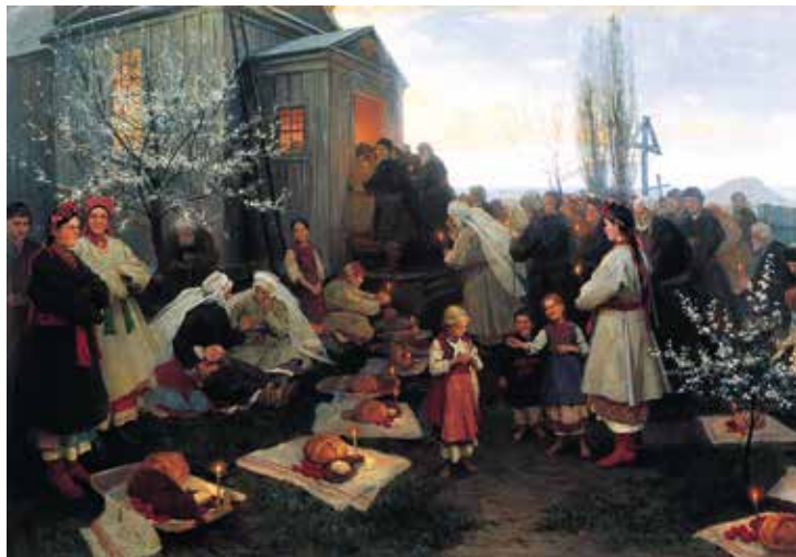
Пасхальная заутреня. Худ. Н.К. Пимоненко. 1891

В ожидании освящения даров Божиих собрались у деревенской церкви православные жители Малороссии на картине «Пасхальная заутреня»