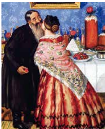
Христосование. Худ. Б.М. Кустодиев. 1916

известного мастера реалистической школы Николая Корнильевича Пимоненко (1862–1912). Храм не вмещает всех желающих. Прихожане в праздничной одежде растелили рушники с яствами по достатку семьи. Уже зажжены свечи, свет которых озаряет храм изнутри, лица молящихся, куличи и сливается с наступающим рассветом. Очарование Святой ночи дополняется любопытными бытовыми