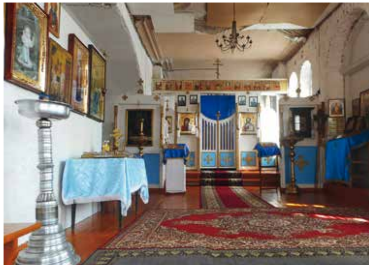
Придел собора, в котором проходят службы

Любая информация очень нужна! А это просто ЧУДО! В нашем соборе служил НОВОМУЧЕНИК!»