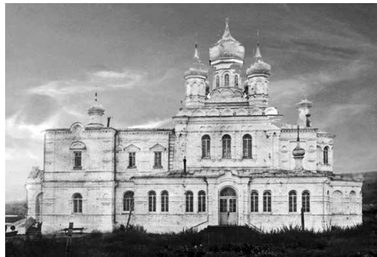
Собор Воскресения Христова, фотография 1913 г.

Ответ пришел, можно сказать, моментально! «...Вы не представляете, какую ценную информацию сейчас сообщили нам! В данный момент готовится презентация о соборе Воскресения Христова. Через три дня мы едем в администрацию нашего района. Решается вопрос о его восстановлении и реставрации.