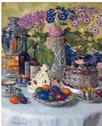
Пасхальный стол. Худ. Н.П. Богданов-Бельский

Праздничный стол на картине Николая Петровича Богданова-Бельского (1868–1945) сервирован изысканным фарфоровым чайным сервизом, украшен цветами. Легкий, элегантный, эстетически выверенный натюрморт выполнен в стиле импрессионизма. Хозяев и гостей с пасхальной службы дожидаются блюда – традиционные символы Воскресения Христова. Для художника, прошедшего после революции 1917 г. двадцать