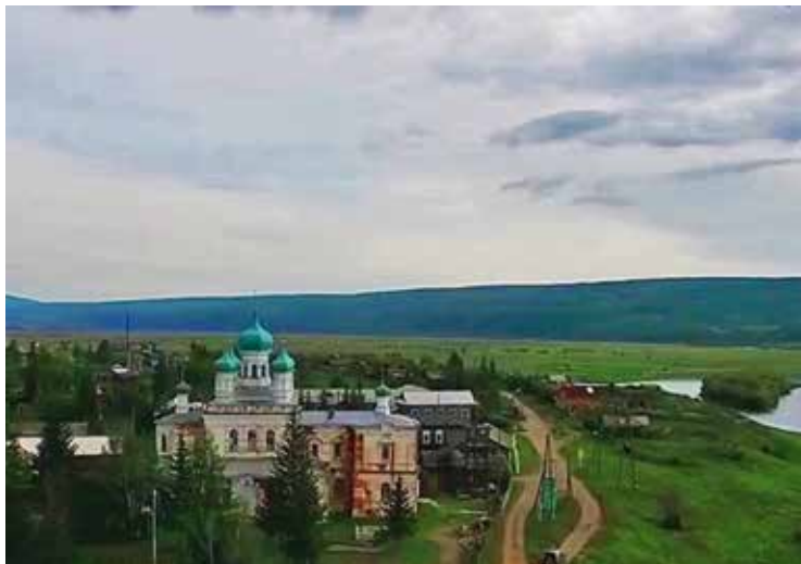
Собор Верхоленска в наши дни